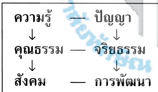
รูปที่ 2 แผนภูมิแสดงความสัมพันธ์ระหว่างคำสำคัญตามหลักการอุดมศึกษา

จากแนวคิดดังกล่าวจะสังเกตเห็นได้ว่ามีคำสำคัญ (Key word) เกี่ยวกับการสร้างคนในระบบอุดมศึกษาหลายคู่ด้วยกัน ได้แก่ ความรู้-ปัญญา คุณธรรม-จริยธรรม สังคม-การพัฒนา ตามรูปที่ 2