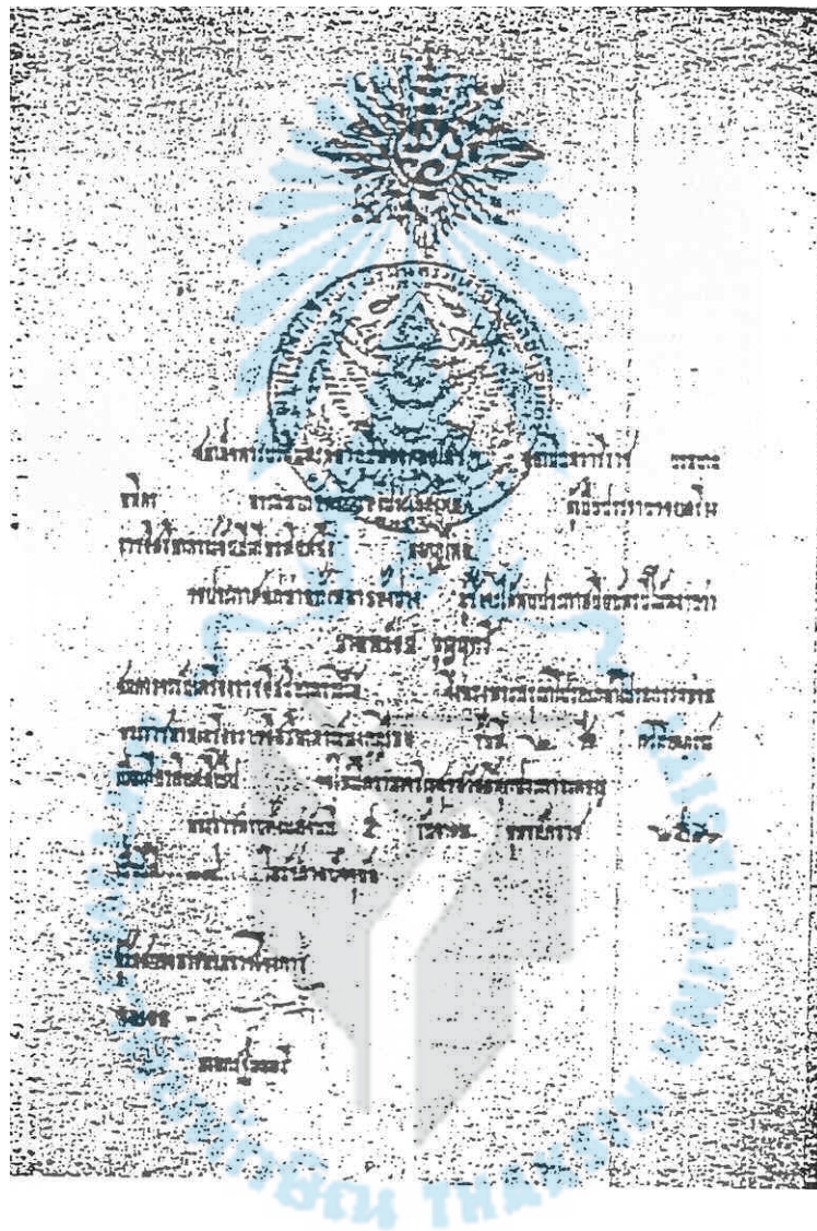
ภาพประกอบ 7 เครื่องราชอิสริยาภรณ์มงกุฎไทย ชั้นที่ 2 ที่มา : ชัดเจน เวชรังษี และสุคนธ์ ศรีจันทร์. เชิดชูเกียรติหนังสือตระกูลพร้อมน้อย. 2528. หน้า 68.