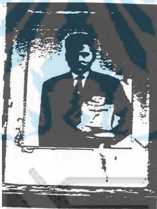
ภาพประกอบ 3 ตันศรีตรังทองคำ ซึ่งเป็นรางวัลที่ได้รับจากการแข่งขันหนังตะลุง ที่สนามโรงเรียนกัลยาณีวิทยาการ อำเภอห้วยยอด จังหวัดสงขลา