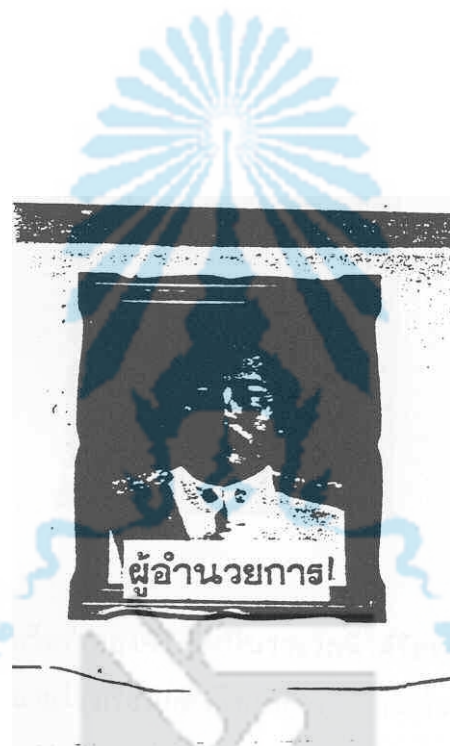
ภาพประกอบ 2 หน้าพร้อมน้อย ตะลุงสากล (ขณะดำรงตำแหน่งสมาชิกสภาผู้แทนราษฎร) เมื่อปี พ.ศ. 2526