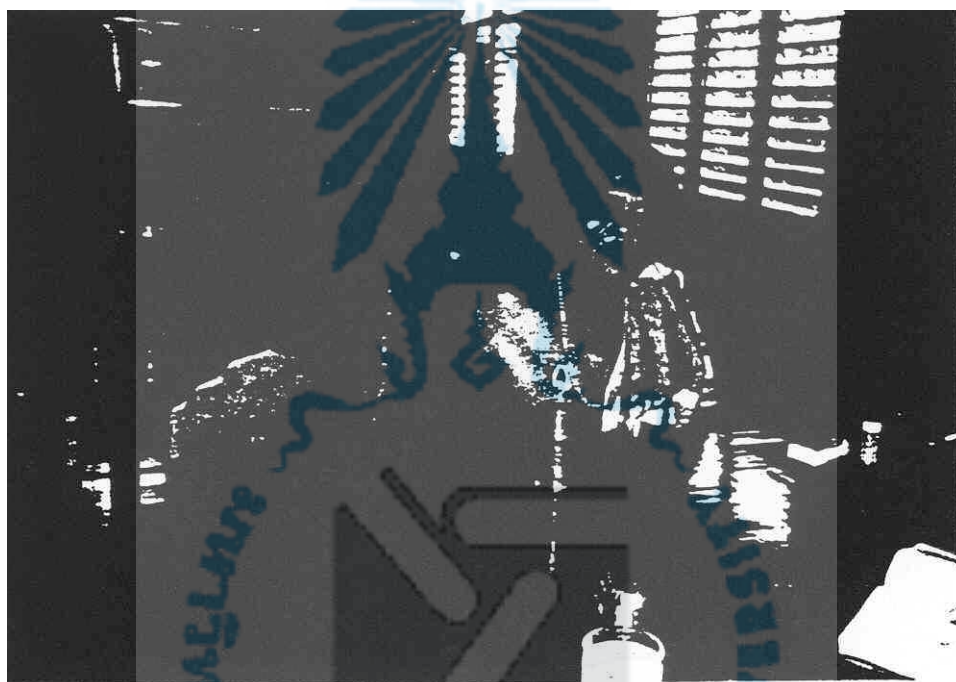
ภาพประกอบ 1 หน้าพร้อมน้อย ตะลุงสากล กำลังให้สัมภาษณ์ที่บ้านเลขที่ 32/4 หมู่ที่ 7 ตำบลท่าแค อำเภอเมือง จังหวัดพัทลุง วันที่ 13 สิงหาคม 2544