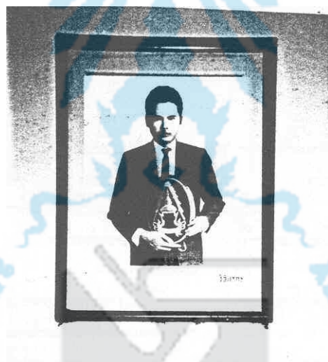
ภาพประกอบ 4 มงกุฎทองคำฝั่งเพชร ซึ่งเป็นรางวัลจากการแข่งขันชิงแชมป์แห่งชาติได้ ณ สนามหน้าเมือง จังหวัดนครศรีธรรมราช