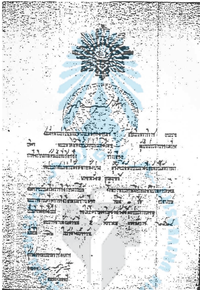
ภาพประกอบ 6 เครื่องราชอิสริยาภรณ์ช้างเผือก ชั้นที่ 3