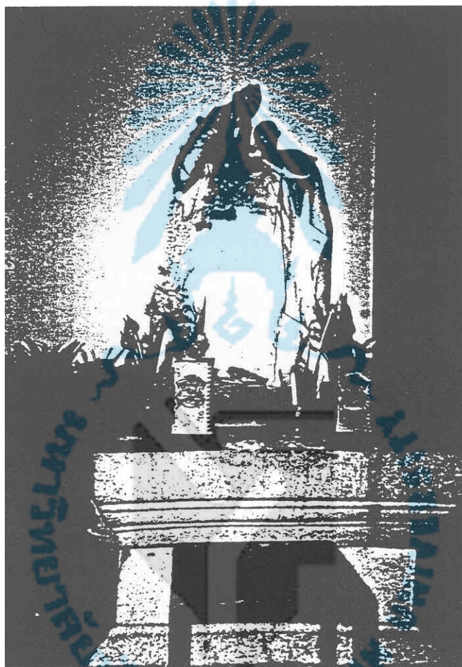
ภาพประกอบ 8 รูปปั้นตาหาล้า ตัวตลกประจำคณะหนังตะลุงพร้อมน้อย ตะลุงสากล